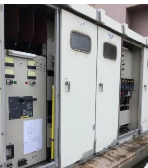
キュービクル扉破損 (暴風)