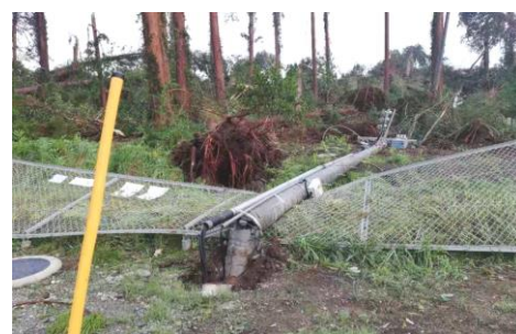
構内柱倒壊 (暴風・倒木)