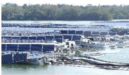
太陽光発電設備崩壊 (暴風)