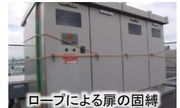
ロープによる扉の固縛