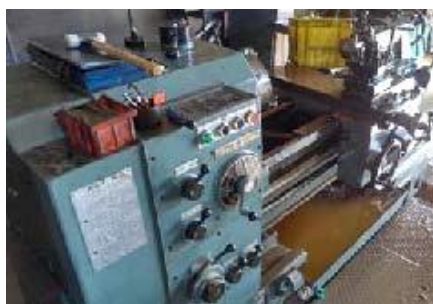
工場内浸水 (豪雨・洪水)

近年、全国各地で豪雨・暴風雨による大規模被害が発生しています。関東エリアでは、2019年の台風15号、19号の襲来時に、各地で電力設備や自家用電気工作物が大きな被害を受けており、長期にわたる大規模停電も発生しました。