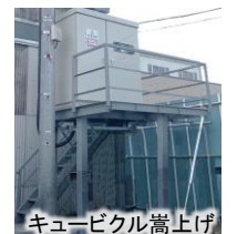
キュービクル嵩上げ