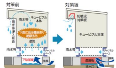
キュービクルの雨水等浸入対策